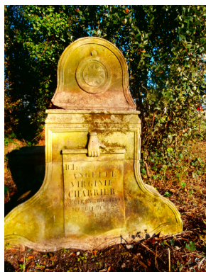
stèle cimetière protestant familial Plordonnier-Mornac

La MHPC a tenu son Assemblée Générale le 24 avril dernier, occasion de présenter ses activités, ses projets et les nouvelles acquisitions.