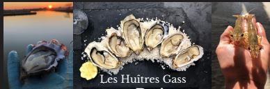
Les Huitres Gass

La Cabane Buissonnière Ostréiculteur/affineur