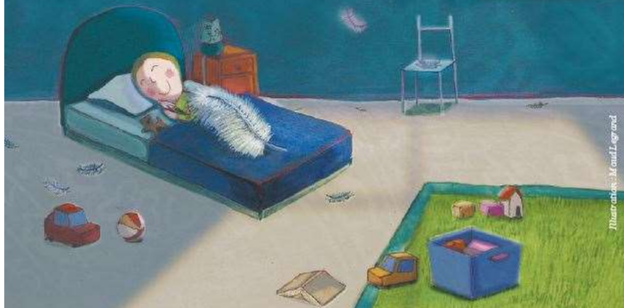
Illustration : M. L. Legend